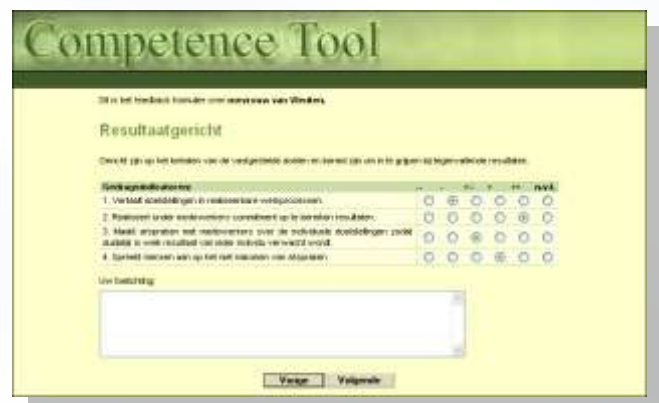
Vragenlijst voor het geven van feedback

De feedbackgever vindt in de vragenlijst een aantal competenties met bijpassende gedragskenmerken. Hij geeft op een vijfpuntsschaal aan in hoeverre dit gedrag van toepassing is op de feedbackaanvrager. De ingevulde vragenlijsten worden automatisch opgeslagen in een database.